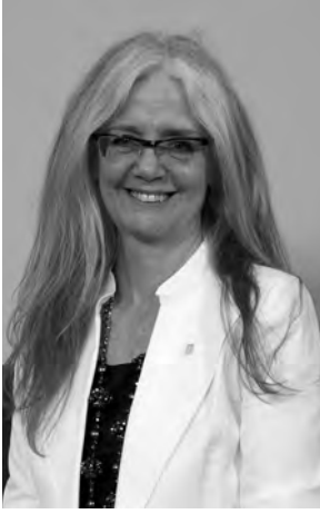
Bâtonnière de Montréal batonniere@barreaude montreal.qc.ca

En prévision de la rédaction du mot de la bâtonnière de l'actuelle édition de l'ExtraJudiciaire, je discutais avec une amie au sujet du thème proposé ce mois-ci, soit celui de « Crimes et châtements ».