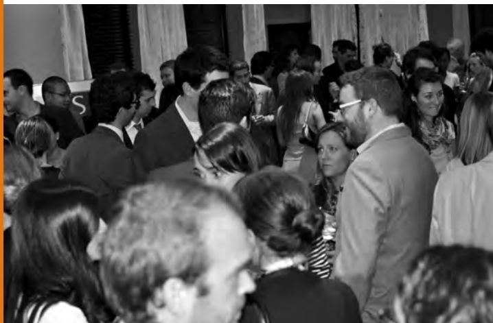
Cocktail du Président à la Suite 701