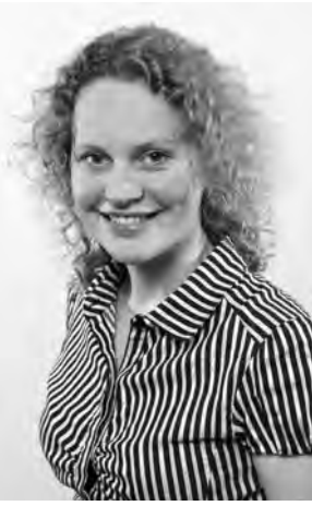
rédatrice en chef clarose@m-x.ca