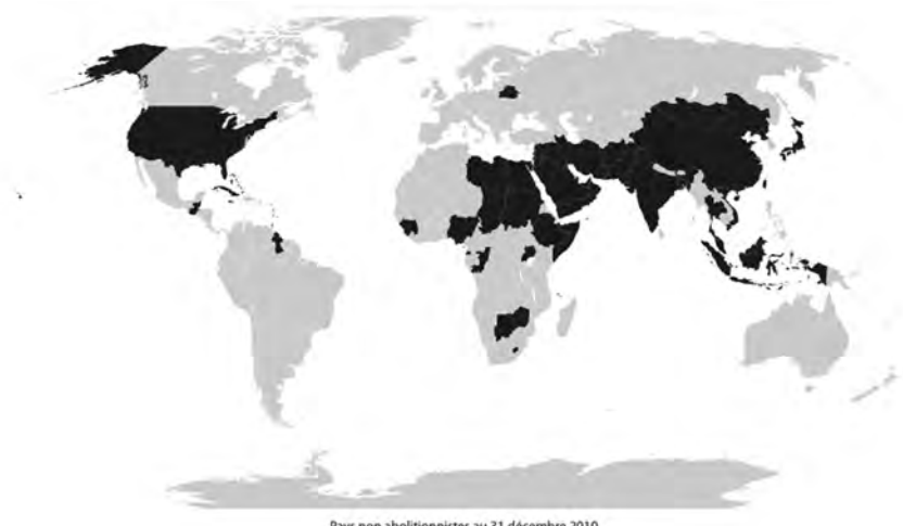
Pays non abolitionnistes au 31 décembre 2010

Dans un rapport de 2010, Amnesty internationale confirmait qu'au cours des 10 dernières années, plus de 30 pays ont aboli en droit ou en pratique la peine de mort. Plus spécifiquement, le Gabon a définitivement aboli la peine capitale en 2010, réduisant ainsi le nombre de pays non abolitionniste à 58. Un moratoire officiel sur les exécutions a été prononcé par le président de la Mongolie en janvier dernier. En mai 2011, le nouveau président du Myanmar a commué toutes les condamnations à mort à l'emprisonnement à vie. Même si la Chine est le pays procédant au plus grand nombre d'exécutions, Amnesty internationale a constaté quelques progrès, dont plusieurs crimes qui ne sont plus passibles de la peine capitale. Il est