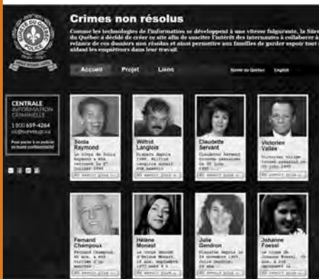
Le site internet www.crimesnonresolus.com présente 16 cas de meurtres qui ont eu lieu sur le territoire de la Sûreté du Québec entre 1977 et 2004.

La mise en ligne du site est un vif succès pour la S.Q. En effet, cette dernière a noté une recrudescence des informations transmises par le public relativement aux cas présentés sur le site. Déjà, quelques semaines