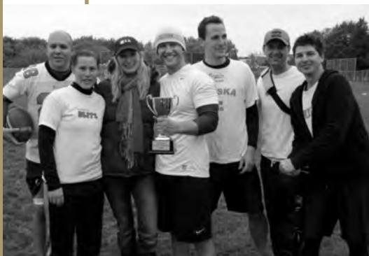
L'équipe SCORBUT - championne 2011.

C'est sous les nuages, le vent et une pluie nous rappelant que l'hiver n'est pas si loin, que l'AJBM présentait la Coupe ZSA-AJBM de flag football. Malheureux destin pour plusieurs joueurs qui, à défaut de mettre la main sur la Coupe, ont rapporté un petit rhume à la maison.