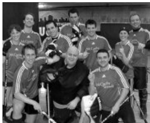
L'équipe championne, McCarthy Tétrault.

Le 21 mars dernier avait lieu la 2 e édition du tournoi de hockey cosom de l'AJBM. Un grand nombre de participants (6 équipes et leurs spectateurs) se sont réunis au centre sportif de l'UQAM lors de cette journée. Nous avons eu la chance d'assister à un niveau de compétition très relevé ! McCarthy Tétrault, Gauthier Bédard et Papineau & Associés se sont nettement démarqués toute la journée avec quatre victoires et une défaite chacun durant la ronde préliminaire. Toutefois, lors de la grande finale, c'est l'équipe de McCarthy Tétrault qui a arraché le titre de champion de l'AJBM par un blanchissage de 4 à 0 contre Gauthier Bédard, l'équipe gagnante de l'édition de l'an dernier. En fond de classement avec une victoire et quatre revers chacun, nous pouvons souligner les grands efforts et le bon esprit sportif des équipes de Stikeman Elliott, des « Poilus » et des « Perdants ». Nous tenons à remercier tous les participants, les organisateurs, la permanence de l'AJBM et les bénévoles qui se sont impliqués lors de cette journée mémorable.