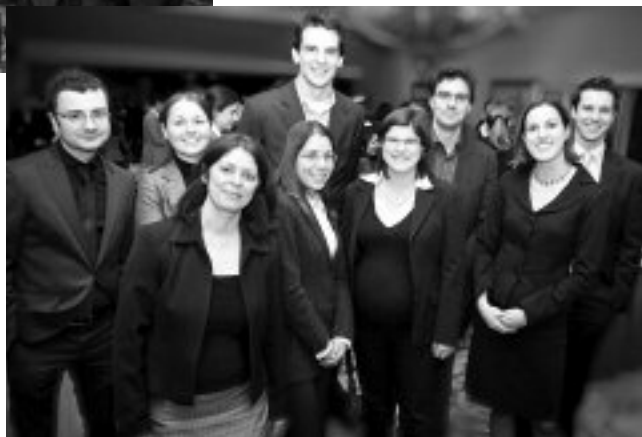
Une partie de l'équipe des collaborateurs du Guide.

Pour ceux et celles qui n'ont pu assister à la soirée et qui ignorent ce que contient le Guide de démarrage de l'entreprise, nous profitons de l'occasion pour vous en faire part. Ce guide, fruit du travail dévoué des bénévoles de l'AJBM, est un recueil de 16 textes traitant de divers sujets relatifs au fonctionnement d'une entreprise, de sa création à sa dissolution. Les thèmes abordés dans l'ouvrage