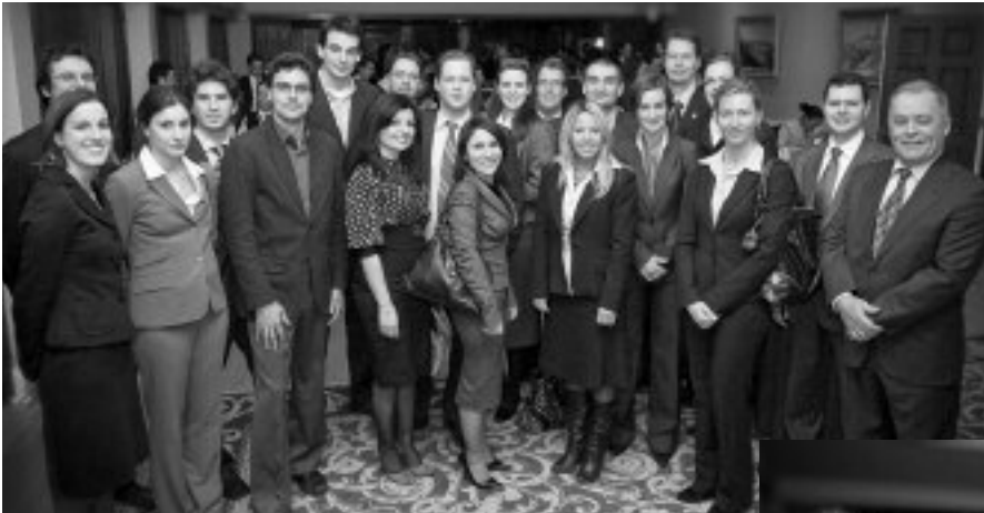
Certains membres du conseil d'administration de l'AJBM accompagnés des représentants de la Banque Scotia.

Il convient de souligner non seulement l'apport des bénévoles dans la consécration de ce projet, mais également celui des nombreux partenaires, soit Bergman & Associés, le CRAC, Fasken Martineau, Gowlings et McMillan.